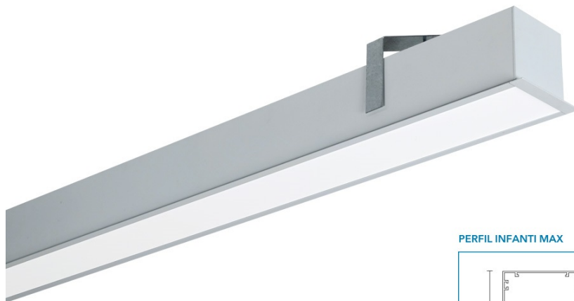
PERFIL INFANTI MAX

Tratamiento de superficie: Pintura polvo poliéster